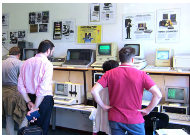
Museo del Calcolatore