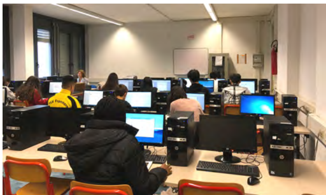
Laboratori di Informatica

Con il nostro diploma si accede anche ai nuovi corsi biennali post-secondari negli istituti tecnici superiori (ITS)